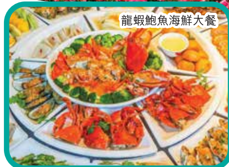
龍蝦鮑魚海鮮大餐

酒店早餐 ~ 海南 ~ 焦點遊 尋找海南古跡【騎樓老街】 打卡【海口鐘樓】 ~ 午餐 ~ 焦點遊 總投資1600億 由600多名世界頂級建築大師設計全球最大花型人工島【海花島】~ 入住千億打造 全新5星標準【海花島歐堡酒店】~