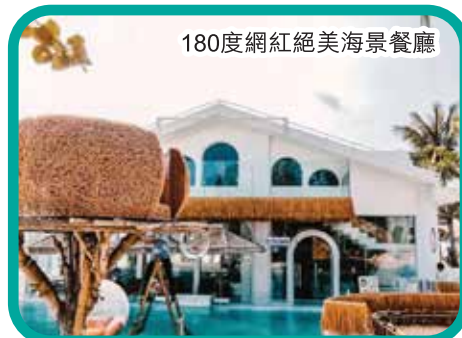
180度網紅絕美海景餐廳

備註: 燈光秀受天氣、環保、政府政策因素等影響, 不保證每天開放, 若不能正常開放, 不做其他補償。 海花島燈光秀正常開始時間為: 20:30/21:30