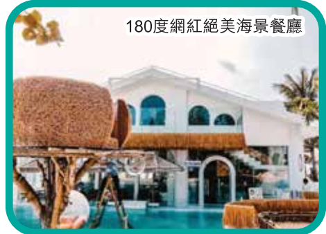
180度網紅絕美海景餐廳