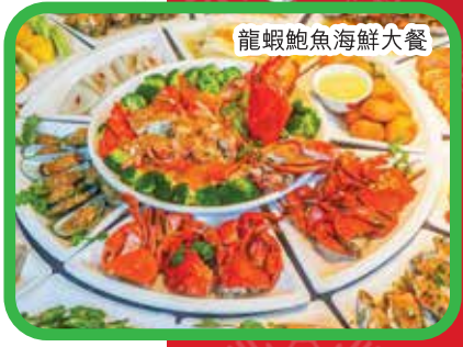
龍蝦鮑魚海鮮大餐