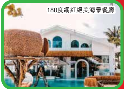
180度網紅絕美海景餐廳