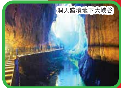
洞天盛境地下大峽谷

酒店早餐 ~ 南丹 ~ 焦點遊 【南丹銅江公園】位於廣西南丹縣中心城區，始建於20世紀30年代，結合南丹本土自然風貌，濃縮南方植物群落之風姿，彰顯南丹奇山秀峰之特色 ~ 焦點遊 【白褲瑤寨景區】(自費套票)是一個展現白褲瑤族特有的生產、生活、生命狀態，沒有圍牆的活態實景博物館 ~ 焦點遊 【洞天盛境地下大峽谷景區】(自費套票)國內罕見的總長約3.5公里的地下大峽谷、地下暗河、溶洞奇觀於一體，在高瀑飛瀉、雄渾瑰麗、百轉千回的天然水墨畫溶洞中體驗大自然的鬼斧神工 ~ 焦點遊 【歌婭思穀景區】(自費套票)中國瑤族特色村寨、被譽為“東方最美愛情穀”晚上可以在歌婭思穀體驗 ~ 晚餐 ~ 參加具有白褲瑤特色的【篝火晚會】與當地的阿哥阿婭們一起度過一個難忘之夜 (備註:該專案不收費如過不可抵抗原因取消,不作賠償) ~ 晚餐 ~ 入住酒店