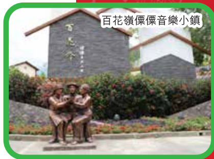
百花嶺傈僳音樂小鎮