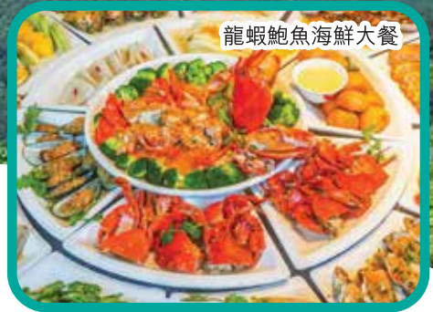
龍蝦鮑魚海鮮大餐

酒店早餐 ~ 焦點遊 乘【豪華遊艇出海】(非包船) ~ 焦點遊 【天涯海角】“北覽萬里長城，南遊天涯海角”不到天涯海角，就不算到過海南 ~ 晚餐 ~ 入住酒店