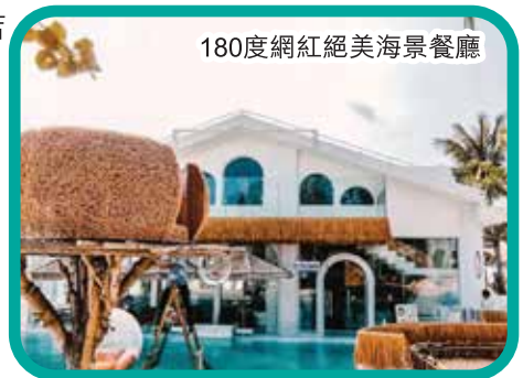
180度網紅絕美海景餐廳

酒店早餐 ~ 睡到自然醒 ~ 約10點左右離開酒店 ~ 焦點遊 打卡醉美沿海公路【太陽灣公路+海灘】這裡一邊是山，一邊是海，短短6公里距離，每一步都是風景 ~ 焦點遊 遊覽【七仙嶺森林公園】七仙嶺又名七指嶺，以七個狀似手指的山峰而得名，前峰高大，海拔1107米，後六峰相依而小 ~ 入住酒店體驗溫泉，七仙嶺溫泉屬於矽酸重碳酸鈉型溫泉，具有較高的醫療保健價值 ~ 晚餐 ~ 自由浸泡溫泉