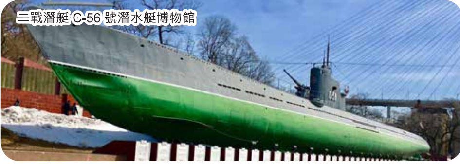
三戰潛艇 C-56 號潛水艇博物館