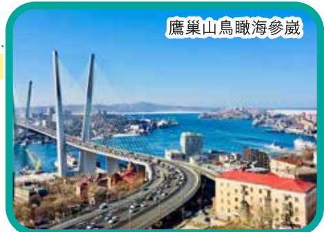
鷹巢山鳥瞰海參崴