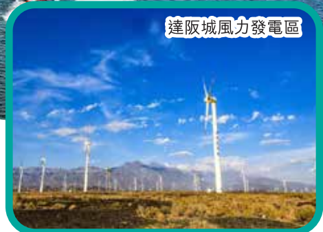
達阪城風力發電區