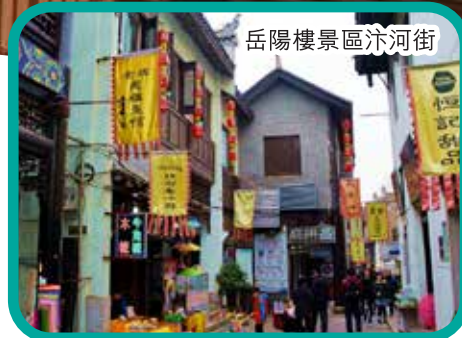
岳陽樓景區汴河街

指定時間於落馬洲[福田口岸] (1號門外)集合 ~ 乘地鐵 或巴士前往【深圳北站】/【廣州南站】~ 轉乘高鐵動車組前往【岳陽站】~ 午餐(列車上自理) ~ 遊覽2007中國湖南旅遊節開幕式活動場地之一的【岳陽樓景區汴河街】~ 乘車【外觀岳陽樓】~ 宜昌 ~ 入住酒店