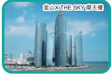
釜山X THE SKY 摩天樓

酒店早餐 ~ 焦點遊 海雲台天空膠囊車廂(四人一台) ~ 紅白燈塔 ~ 青沙浦踏石天空步道 ~ 焦點遊 釜山X THE SKY 摩天樓(多媒體高速電梯、360度觀景台、世界最高星巴克) ~ 入住酒店