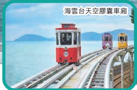
海雲台天空膠囊車廂