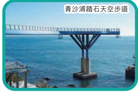
青沙浦踏石天空步道

酒店早餐 ~ 彩妝名品店 ~ 機張市場 ~ 人蔘專賣店 ~ 肝保養專賣店 ~ 焦點遊 海苔博物館(韓服體驗) ~ 釜山樂天outlet ~ 樂天超市 ~ 入住酒店