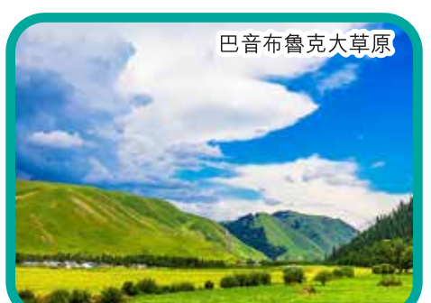
巴音布魯克大草原

酒店早餐 ~ 焦點遊 5A景區【 巴音布魯克大草原 】(包門票、區間車) 巴音布魯克大草原 ~ 入住酒店