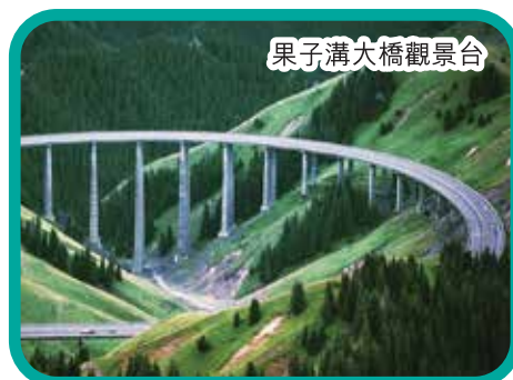
果子溝大橋觀景台

Day5 酒店早餐 ~ 上午喀納斯自由活動 ~ 焦點遊 前往喀納斯經典三灣（神仙灣、月亮灣、臥龍灣）遊覽 ~ 前往賈登峪換乘旅遊巴 ~ 焦點遊 【五彩灘】（包門票）五彩灘屬於特殊的彩色丘陵地貌，岩石層中因含有不同的礦物質而擁有不同的顏色，在常年的額爾齊斯河沖刷和風化剝蝕下，岩層抗風能力不一，形成了獨特的顏色不同輪廓參差的河灘。在陽光的照耀下，五彩灘的不同岩層顯色度會更鮮豔明，紅、橘、黃、紫、白五色分明