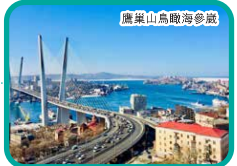
鷹巢山鳥瞰海參崴