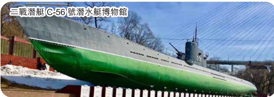
三戰潛艇 C-56 號潛艇博物館